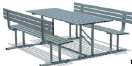
TLP/080.FM.Z Zincato a caldo

Art. TLP/080.FM.V - TAVOLO CON PANCHE ORION- FULL METAL- ZINCATO A CALDO E VENICIATO Art. TLP/080.FM.Z - TAVOLO CON PANCHE ORION- FULL METAL- ZINCATO A CALDO