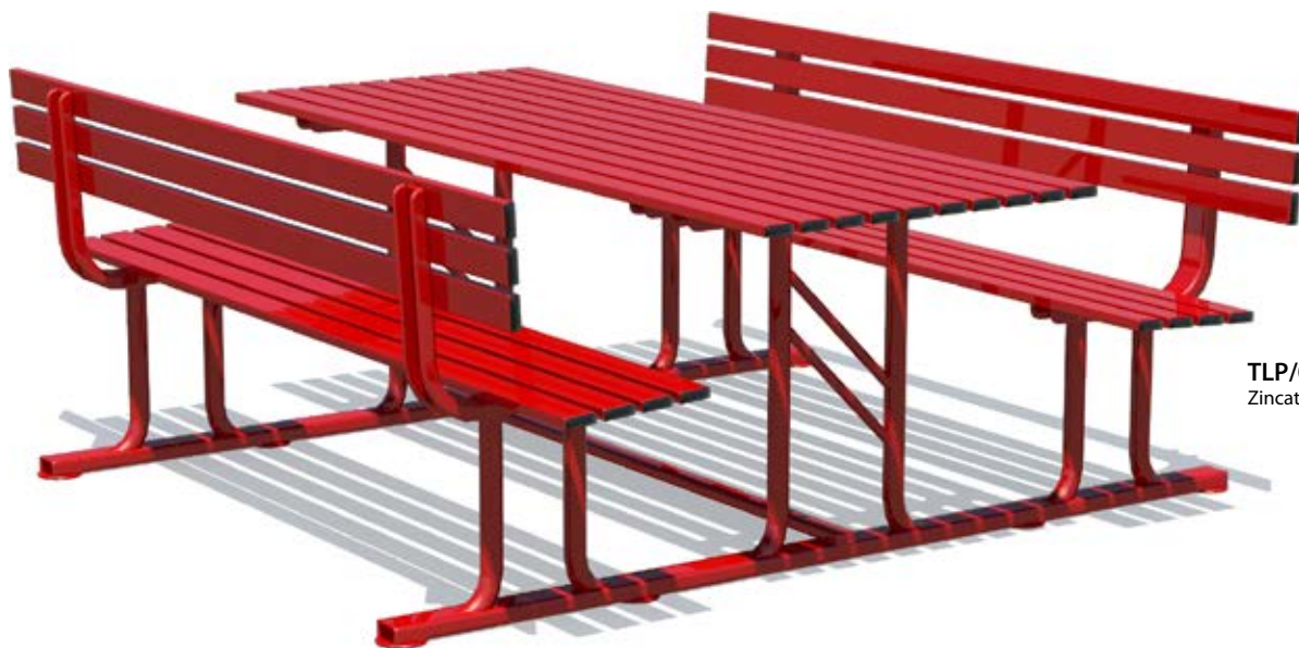
TLP/080.FM.V Zincato a caldo e verniciato